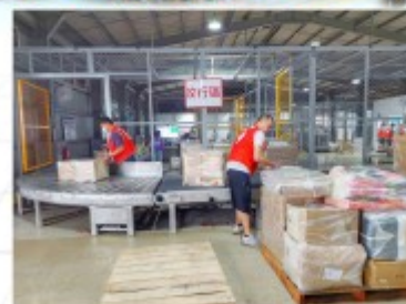
人員進入倉間應穿著不同顏色背心，提高人員辨識度。