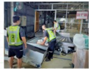
人員進入倉間應穿著不同顏色背心，提高人員辨識度。