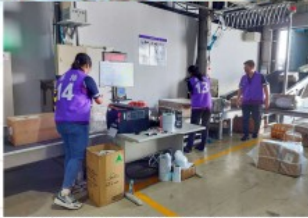
人員進入倉間應穿著不同顏色背心，提高人員辨識度。