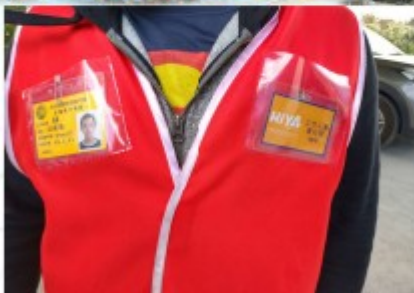
人員進入倉間前應將背心穿上，報關證或承攬業證及臨時通行證也要一併配上。