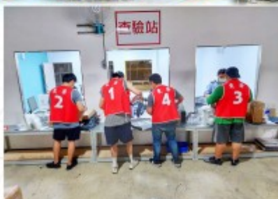
人員進入倉間應穿著不同顏色背心，提高人員辨識度。