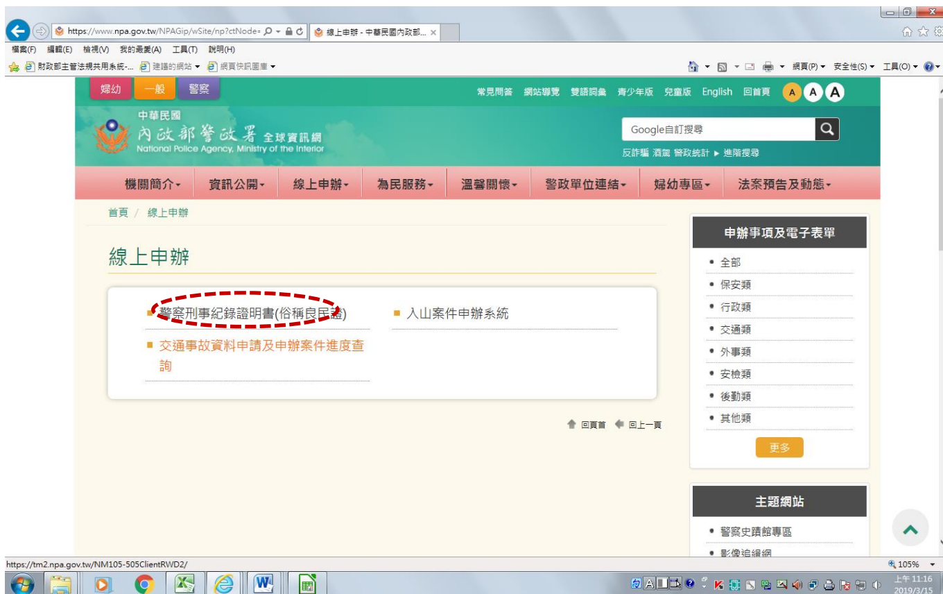
畫面 2(選擇網路申辦)