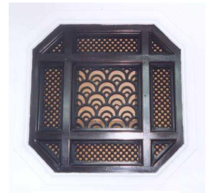
海港大樓負有人文氣息之八角型窗戶