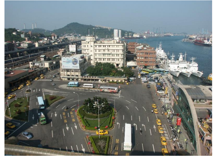
地處交通中心的海港大樓之二

瞭解一個地區社會文化及經濟條件和氣候風上是影響該地方建築生成的主要因素，因此日人在台灣所施行的建築工事，必考慮此因素。台灣地處亞熱帶的島形地理環境屬於高熱多雨的氣候，相對地使用建材亦必須考慮氣候適應的問題；另外不論是公共建築或私人建築，鈴置良一多以生活機能方面為出發點，在基地上的建築配置皆從實質需求做規劃設計，不著眼於形式化的對稱配置模式。