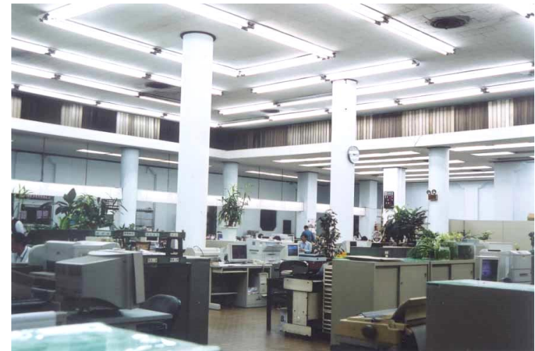
海港大樓之樑柱系統