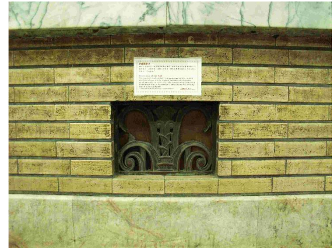
海港大樓一樓大廳櫃檯下之通風孔

在昇降設備方面，建築物主棟之主次出入口處，各設置有昇降機設備，此象徵建築開始走向高層化及現代化趨勢，惟原設備已老舊不堪使用，現已改為新穎之電梯設備。