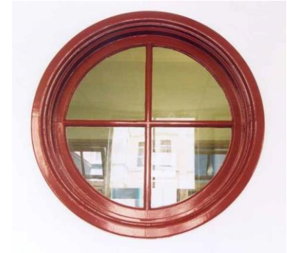
海港大樓圓型窗戶

貴賓室、會議室、餐廳、稅關長室、築港所長室等廳室的天花板周圍，以線板環繞及石膏雕刻，並且配合油漆塗料及壁紙等裝飾，呈現，有新藝術風格味道，但現今已改為各辦公室、並加裝新照明設備，只有少部分處室還保留著當時原貌。