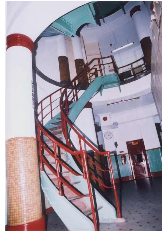
海港大樓五樓迴旋樓梯

防濕處理方面，因整棟大樓為鋼筋混凝土，在施工過程中難免有所疏漏而形成有中空部分，此一部份必須用適當之材料來補修，可以採貼附面磚或上防水漆等方式處理，方可使外部濕氣不至透過鋼筋混凝土壁傳入內部，尤其在鄰近港口之建築。