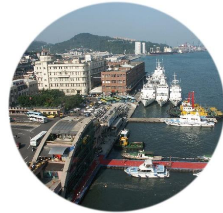
地處交通中心的海港大樓之一

現代建築擺脫過去傳統 師徒制之手工藝時代的建造模式，而採用集體性、機械化的建築模式，並隨著科學與技術的發達帶給人們更便利性與普及性，強調國民大眾的生活，以象徵社會解放及進步的年代。