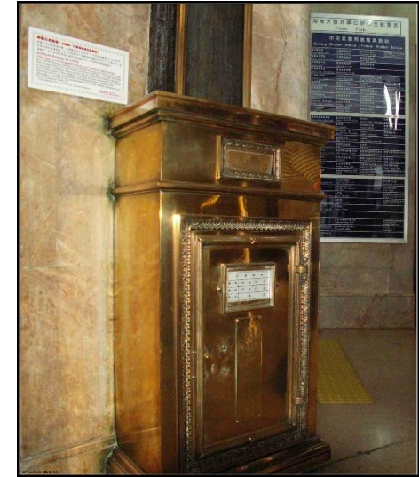
日治時期沿用至今之郵筒

另因建築鄰近港邊，在基隆多山多雨又加上暴風雨常高於海平面的情況下，建築師鈴置良一特別考量設置乾燥烤箱及防豪雨之排水設施，各樓層均設有排水溝，經流入下水道後排入大海。