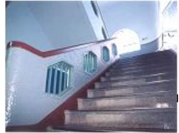
海港大樓樓梯一隅

窗戶原設計為二層之上下拉窗，上層為室內通風換氣用，現已改為鋁製水平推窗，部分窗戶則採用鑄鐵金屬器物構件，樓梯轉角採圓弧設計，樓梯間則嵌入金屬鑄件，特別設計成幾何曲線圖形表現出「新藝術」對「裝飾派」，在各所空間之裝飾則採用銅製品，另室內裝修之木材採上漆處理，而在構造外部則使用紅檜及杉木裝修。 回目錄