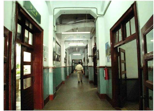
海港大樓一樓長廊 現已成立文化藝廊

在經過了二次大戰美軍轟炸、大地震、大水災之洗禮，建築物依然屹立，再觀其設計之理念與形式，與現代之建築毫不遜色，並將環保、消防之觀念溶入整個建築之中，不得不令人欽佩設計者高瞻遠矚的理念。 回目錄